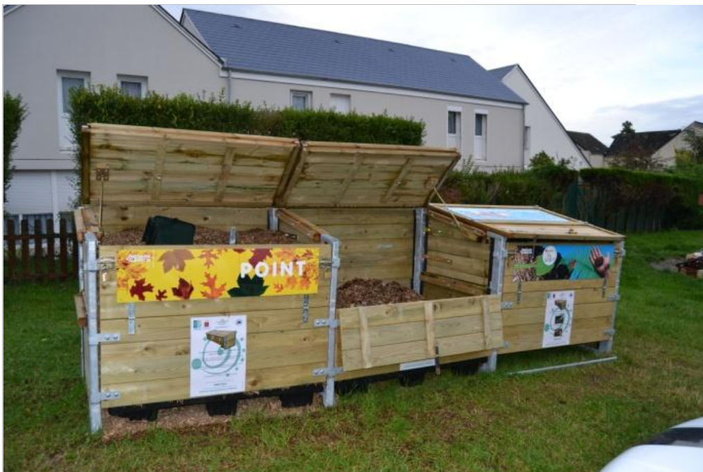
Site de compostage en pied d'immeubles à Laon