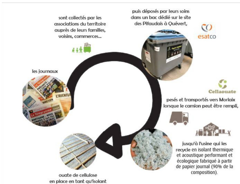
Schéma de structuration de la filière :

Les papiers acceptés sont ceux de la sorte "journal" c'est-à-dire l'ensemble de papiers imprimés en noir et/ou couleurs sur un support de type journal, tels que les journaux et gratuits. Ils doivent répondre à des caractéristiques techniques en entrée d'usine (ex : humidité inférieure à 12%, totalement exempts de corps étrangers, ...). Ces paramètres sont vérifiés par la personne responsable des dépôts sur le site d'esatco (nouveau tri sur place par les associations si besoin) et lors de la collecte de Cellaouate (containers non conformes pouvant être laissés sur place).